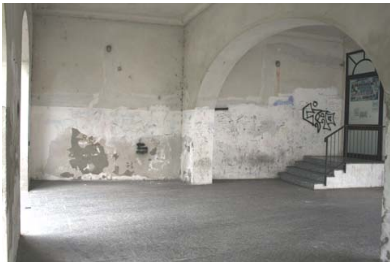
Veduta complessiva dell'area su cui realizzare il murale

Va precisato che il lato frontale della colonna centrale non è da considerarsi parte del murale perché su essa verrà posto un pannello serigrafato con: