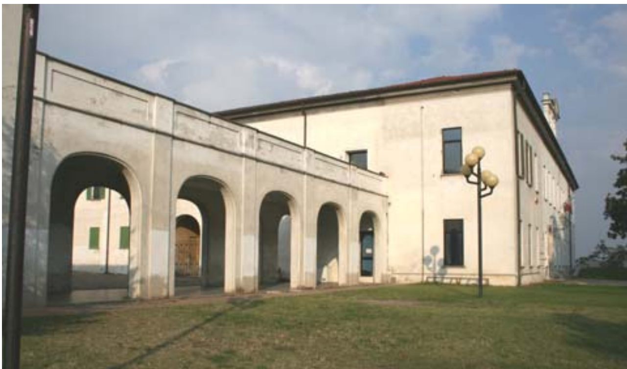
Veduta esterna della Villa Trolliet

L'area su cui è prevista la collocazione dell'opera si trova presso la Villa Trolliet, in viale Paganini, 23 a Oleggio (Novara)