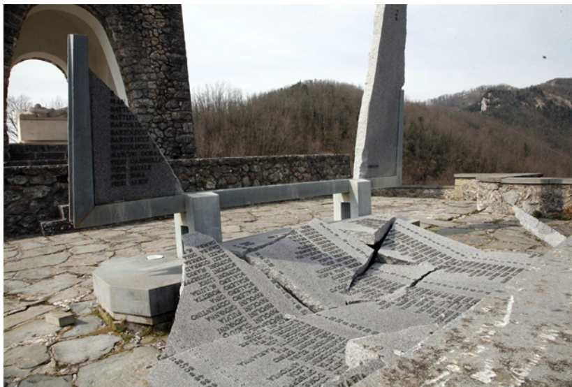
I resti del sacrario di S. Anna di Stazzema

Bisogna ripristinare appena possibile la situazione precedente, perché si tratta di un luogo che ricorda una orribile strage ed è meta di molti, commossi visitatori. Abbiamo tutti un debito verso le vittime. Salviamo almeno il ricordo e i luoghi che lo rappresentano.