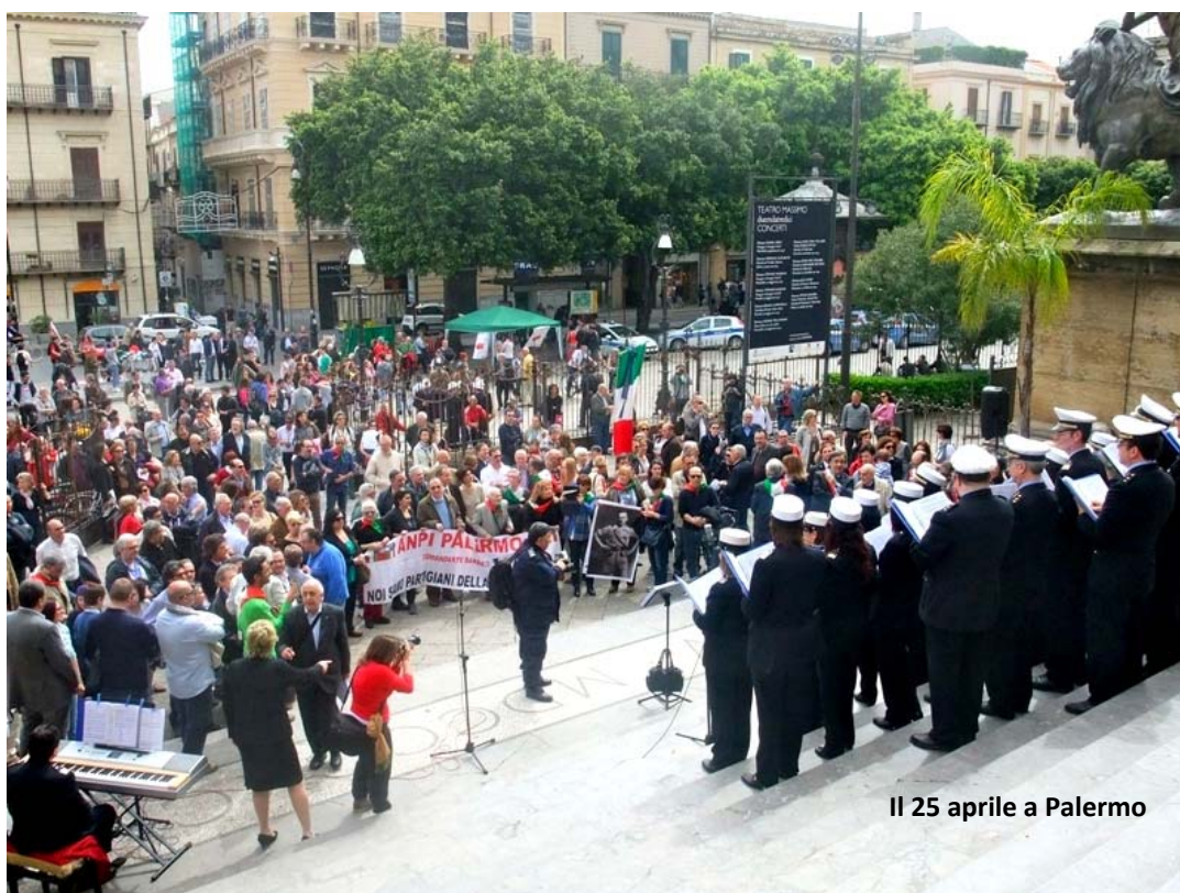
Il 25 aprile a Palermo

Straordinaria la mobilitazione dell'ANPI per il 25 aprile: in tutte le 110 Province del Paese sono state realizzate iniziative che hanno registrato un'altissima partecipazione di cittadine e cittadini. Tantissimi i giovani. Straordinaria, e appassionata, anche la presenza dei vertici istituzionali: la Presidente della Camera Laura Boldrini a Milano e il Presidente del Senato Pietro Grasso a Marzabotto. Entusiasmo, impegno e ragguardevoli risultati nel sud: in Calabria per la prima volta si è celebrata la festa della Liberazione in tutte le città. Da segnalare a Reggio Calabria l'intervento della Vice Presidente del Senato Valeria Fedeli e a